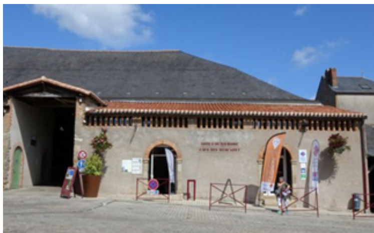
Le bureau d'accueil de Clisson

L'Office de Tourisme, c'est aussi un service commercialisation :