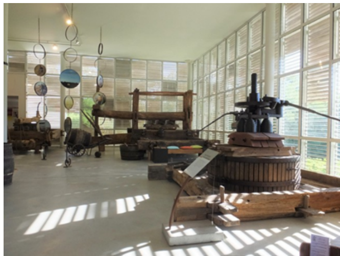
Le Musée du Vignoble Nantais

Il propose des visites adaptées à tous les publics. A l'intérieur, il y a plus de 500 objets à découvrir. Des animations et ateliers sont organisés, pour les adultes et les enfants. Un document de visite FALC est disponible au musée.