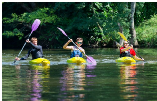
Canoë kayak sur les rivières

La liste des activités est disponible, au bureau d'accueil de Destination Vignoble Nantais.