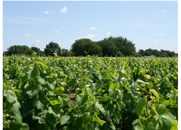
les vignes de Muscadet

Sur nos terres, les vignerons produisent essentiellement du Muscadet. C'est un vin blanc. Le Muscadet se cultive avec des raisins du cépage le « Melon de Bourgogne ». Les cépages sont les différents raisins utilisés pour faire le vin.