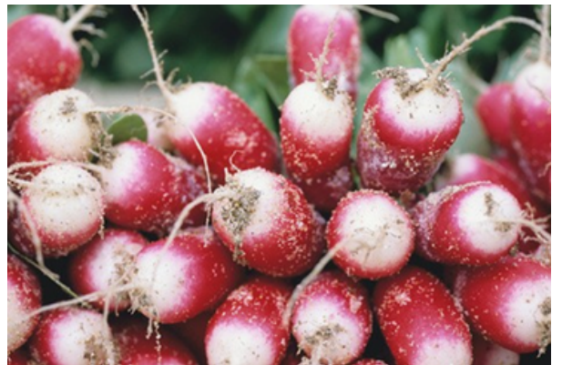
les radis sont des légumes de printemps

Sur les bords de la Loire, des légumes primeurs sont également cultivés. Les légumes primeurs sont les premiers légumes du printemps, les radis la mâche le poireau