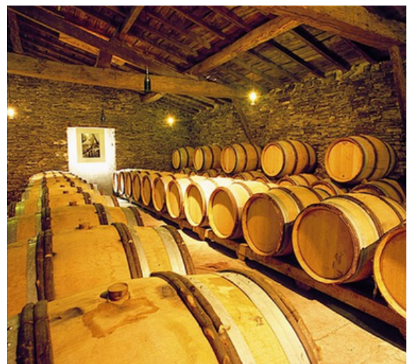
l'intérieur d'une cave chez un vigneron

Vous pouvez demander la liste des vignerons au bureau d'accueil de Destination Vignoble Nantais.