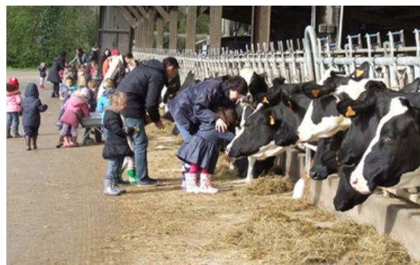
Les animaux de la ferme de la Péquinière