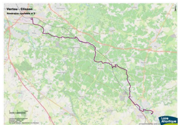
Le circuit le long de la rivière la Sèvre