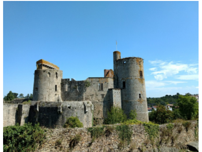
le Château de Clisson

Au 19 e siècle, la ruine du château fait partie du paysage créé par le sculpteur François Frédéric Lemot. Une ruine est ce qui reste d'un bâtiment quand il a été détruit.