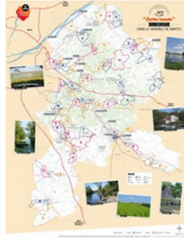
La carte générale des randonnées