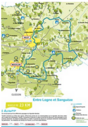
Exemple d'une fiche circuit, autour de la ville de Vallet

La carte générale des circuits vélos est disponible gratuitement au bureau d'accueil de Destination Vignoble Nantais. Toutes les circuits sont visibles sur le site internet levignobledenantes-tourisme.com .