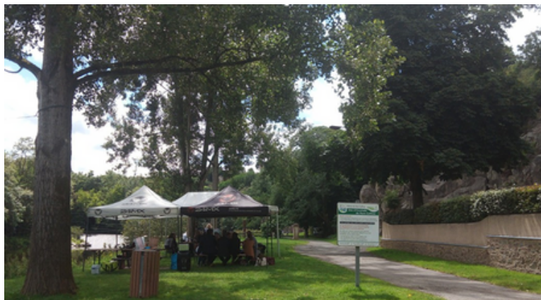
pique nique à Pont Caffino

Il est possible de se promener sur l'eau en bateau ou en canoë kayak.