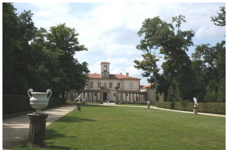
la Garenne Lemot