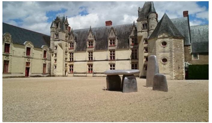
Le Château de Goulaine

On peut aussi se promener dans le jardin.