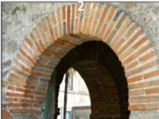
arcs en pleins cintres

On trouve à Clisson des fenêtres avec des arcs en pleins cintres et des baies jumelées.