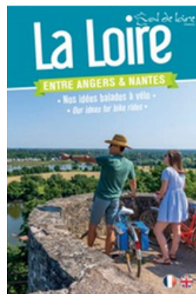
La carte de la Loire à vélo