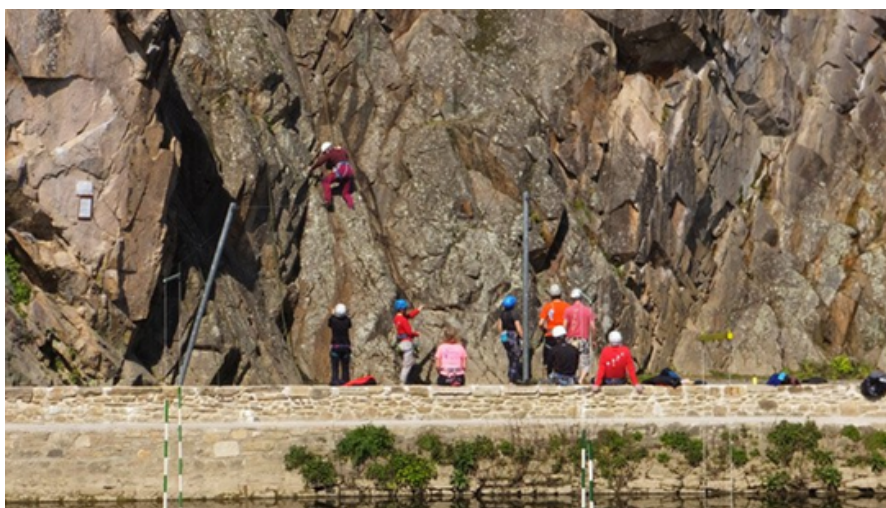
escalade à Pont Caffino