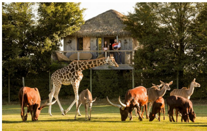
Les animaux du Zoo de la Boissière du Doré

Elle accueille des visiteurs pour les sensibiliser à l'agriculture et la vie des animaux.