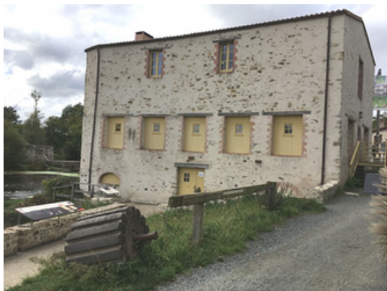
Le Moulin à Papier du Liveau

Le Moulin à Papier du Liveau est un musée. Il propose des visites pour découvrir : les mécanismes du moulin la fabrication des feuilles de papier à la main les machines qui servaient à l'impression des livres et des journaux.