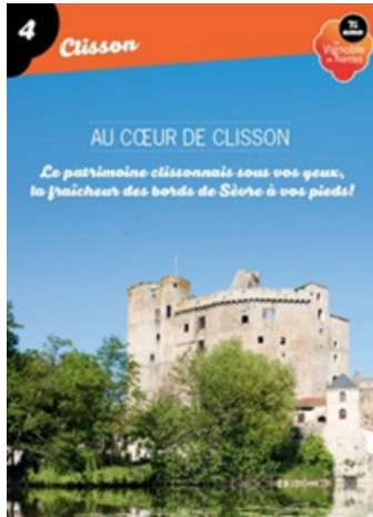
Exemple d'une fiche de circuit pédestre

Vous pouvez parcourir environ 600 kilomètres de chemins. Quelques fiches des circuits, et la carte générale des randonnées sont en vente au bureau d'accueil de Destination Vignoble Nantais. Toutes les fiches de circuits sont visibles sur le site internet www.destination-vignoble-nantais.com .