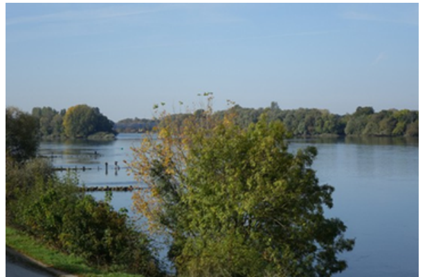
le fleuve La Loire

La Loire est un grand fleuve. Les animaux, végétaux, ou paysages, que l'on peut y découvrir, sont typiques de ce fleuve. Il est également possible d'y pêcher des poissons, que l'on peut déguster dans les restaurants.