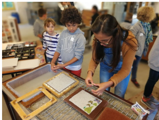
on peut fabriquer du papier