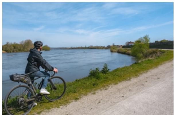
vélo sur les bords de la Loire

Pour admirer les paysages de la Loire, une voie verte longe le fleuve. La voie verte est un chemin de randonnée, réservée aux vélos et aux piétons. Cette voie fait 10 kilomètres. Ce chemin de randonnée fait partie d'un des plus grand itinéraire vélo, qui s'appelle « La Loire à vélo ». Cet itinéraire est un circuit de 900 kilomètres en France, le long de la Loire.