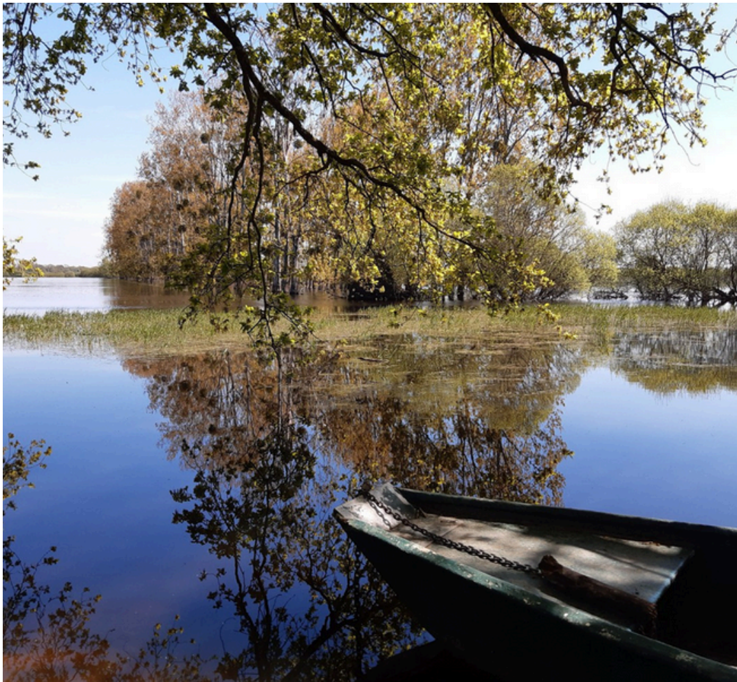
le Marais de Goulaine

Elle propose des expositions et des animations pour mieux découvrir ce site unique.